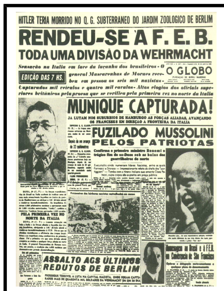
Figura 2 – Capa do Jornal “O Globo” de 30 de abril de 1945, aludindo à rendição alemã

führer se esvaiu, o moral ariano foi rapidamente arrefecido pelo virtual alcance da dignidade sob a tutela de um inimigo honrado. Cerca de 15.000 prisioneiros passaram ao controle da FEB (Figura 2).