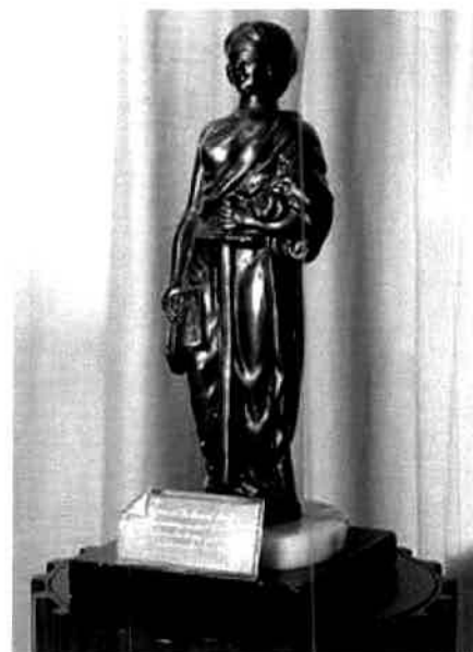
Imagem de uma mulher com olhos vendados e cabelo preso. Vestimenta acinturada, com o ombro direito descoberto, que vai até os pés, deixando apenas os dedos à mostra. Em sua mão direita, carrega um livro com o símbolo da justiça e o nome Justiça nas capas. Na mão esquerda, uma espada que vai da altura da barriga até o fim da panturrilha.