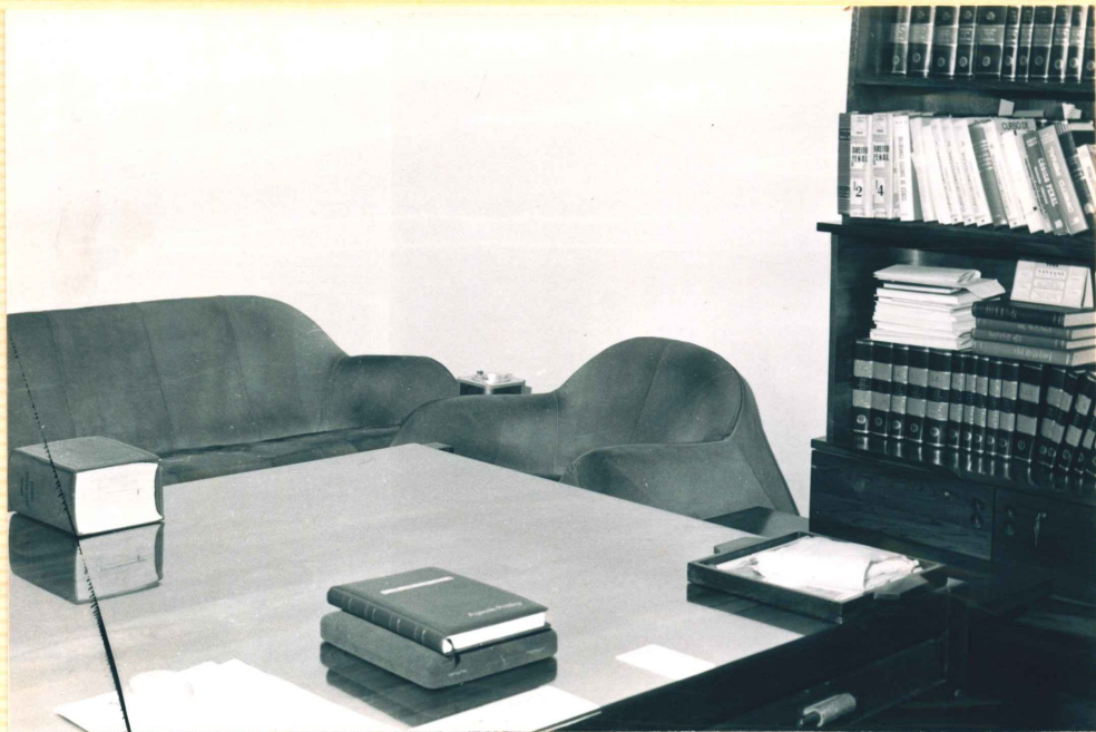
GABINETE DO DR. JUIZ-AUDITOR (DETALHE)