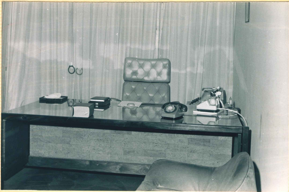
GABINETE DO DR. JUIZ-AUDITOR