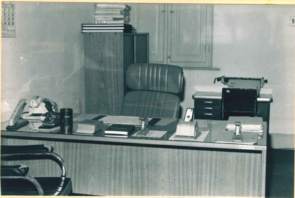
GABINETE DO DIRETOR DE SECRETARIA