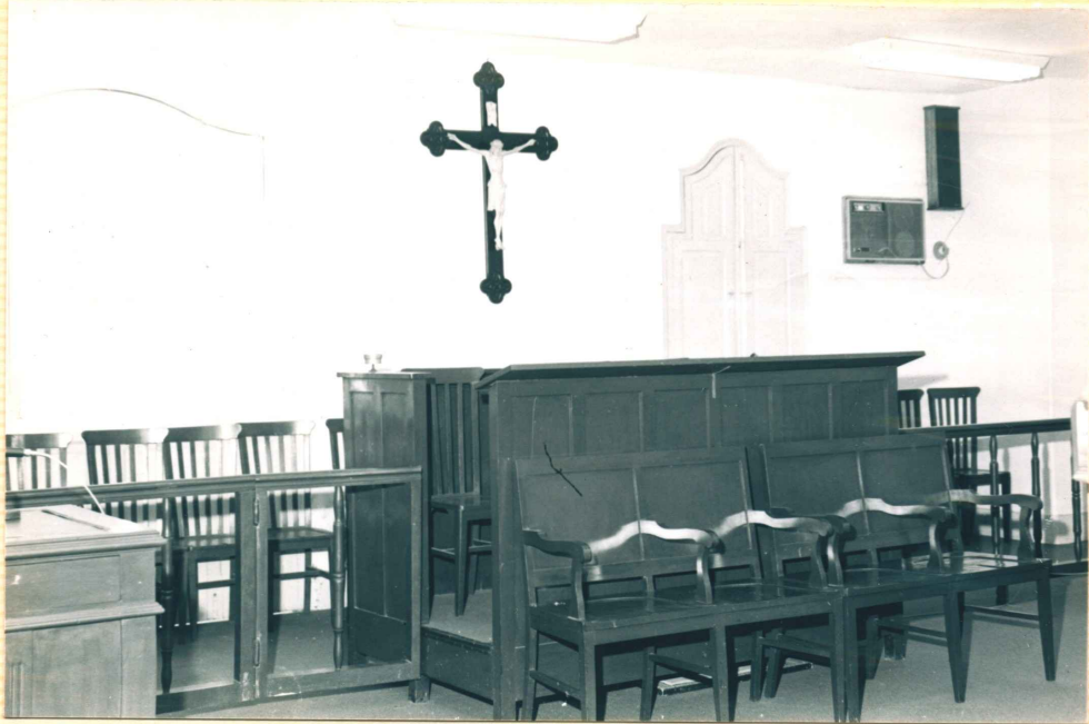
SALA DE SESSÕES