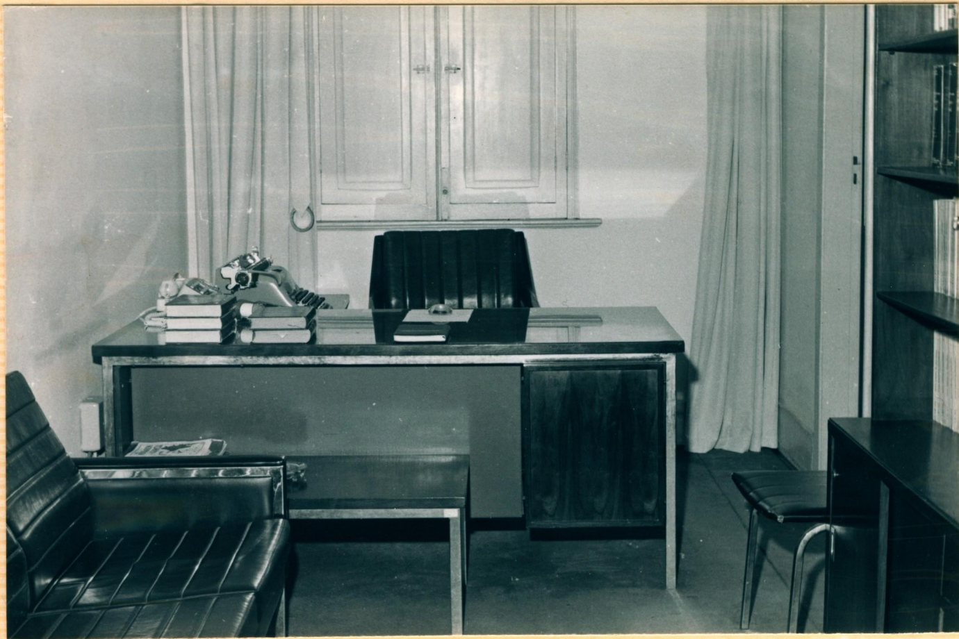
GABINETE DO DR. JUIZ-AUDITOR SUBSTITUTO