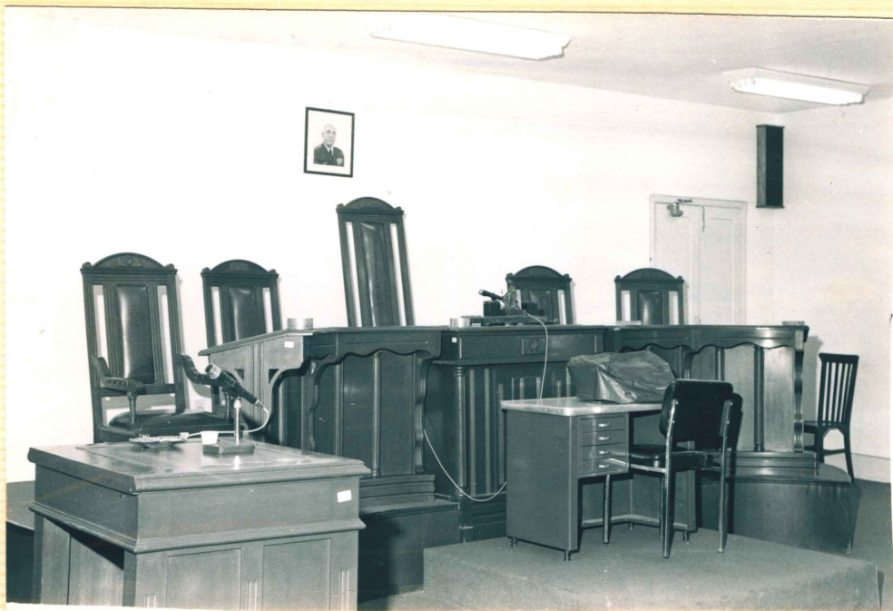
SALA DE SESSÕES (VISTA PARCIAL)