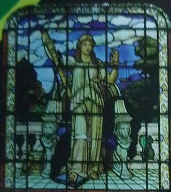
Deusa da Justiça • Foto Alexandre Durão