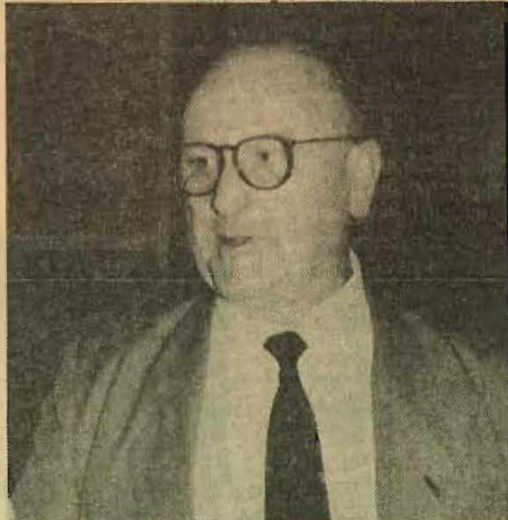
Peruffo: sob a espada da revolução