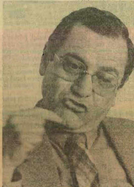
Bisol: faltou coragem aos juizes